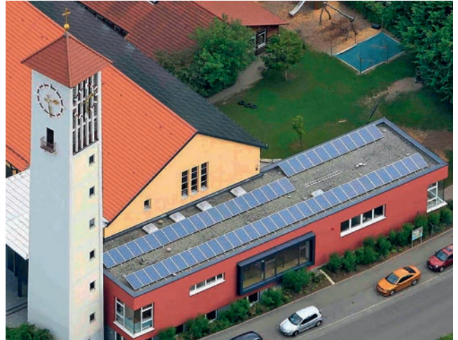
Solardach auf dem Gemeindezentrum Kreuzkirche

und Kirchen verfügen über moderne Heizungssteuerungen und sparen somit CO 2 ein.