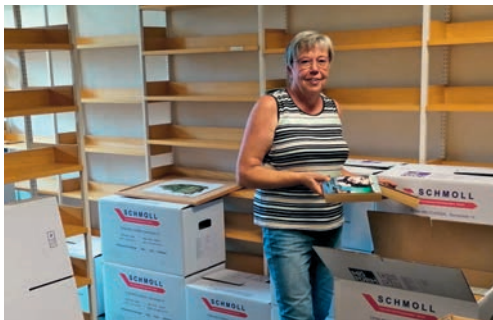
Frau Held packt Bücherkisten