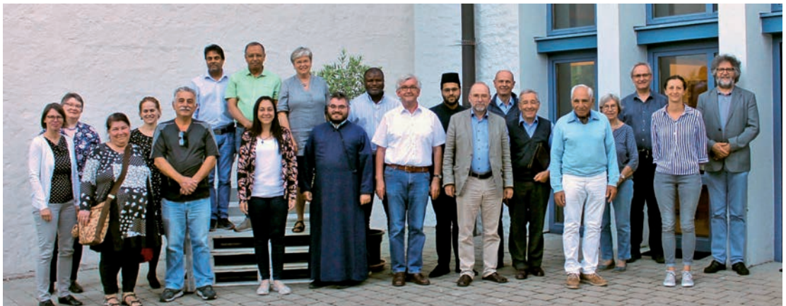
Mitglieder des Rats der Religionen