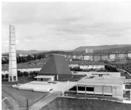
Jubilare-Gemeindezentrum im Jahre 1967

schließende Jubiläumsfest verbindet Vergangenheit und Gegenwart. Eine Übersicht der Veranstaltungen zum Jubiläum entnehmen Sie bitte der örtlichen Presse sowie www.kirche-reutlingen.de und www.orschel-hagen.de (jeweils unter Veranstaltungen).